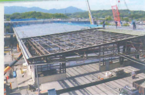
(株)フジダン様 カバービルド(かぶせ工法)