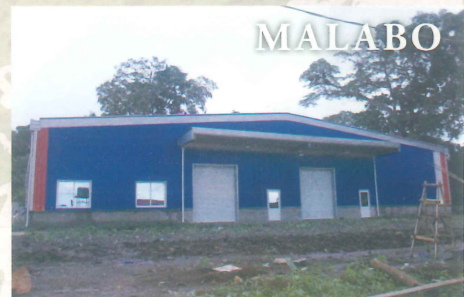
赤道ギニア(浄化水ミネラルウォーター製造)

ベトナム・タイ・カンボジア・中国・赤道ギニア・ネパールなど海外物件にも多数の実績があります。