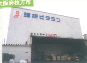
理研ビタミン(株)様