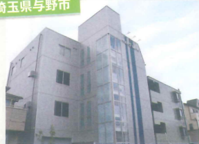
マイクロサーボ(株)様