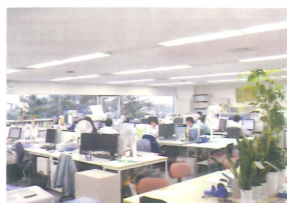
ヨシザワ社内風景(日本橋本社)