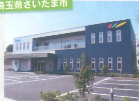
(株)テクノパークシャー様