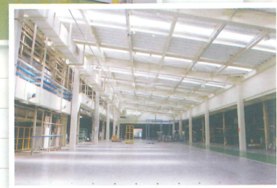
明るい工場工場の対策