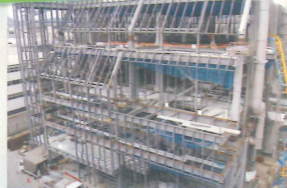
酒造メーカー様 カバービルド(かぶせ工法)