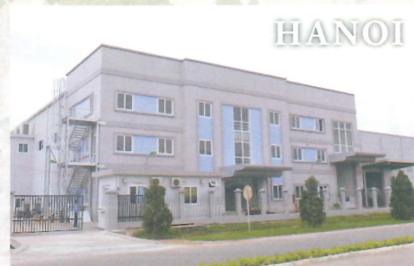
ベトナム(自動車部品)