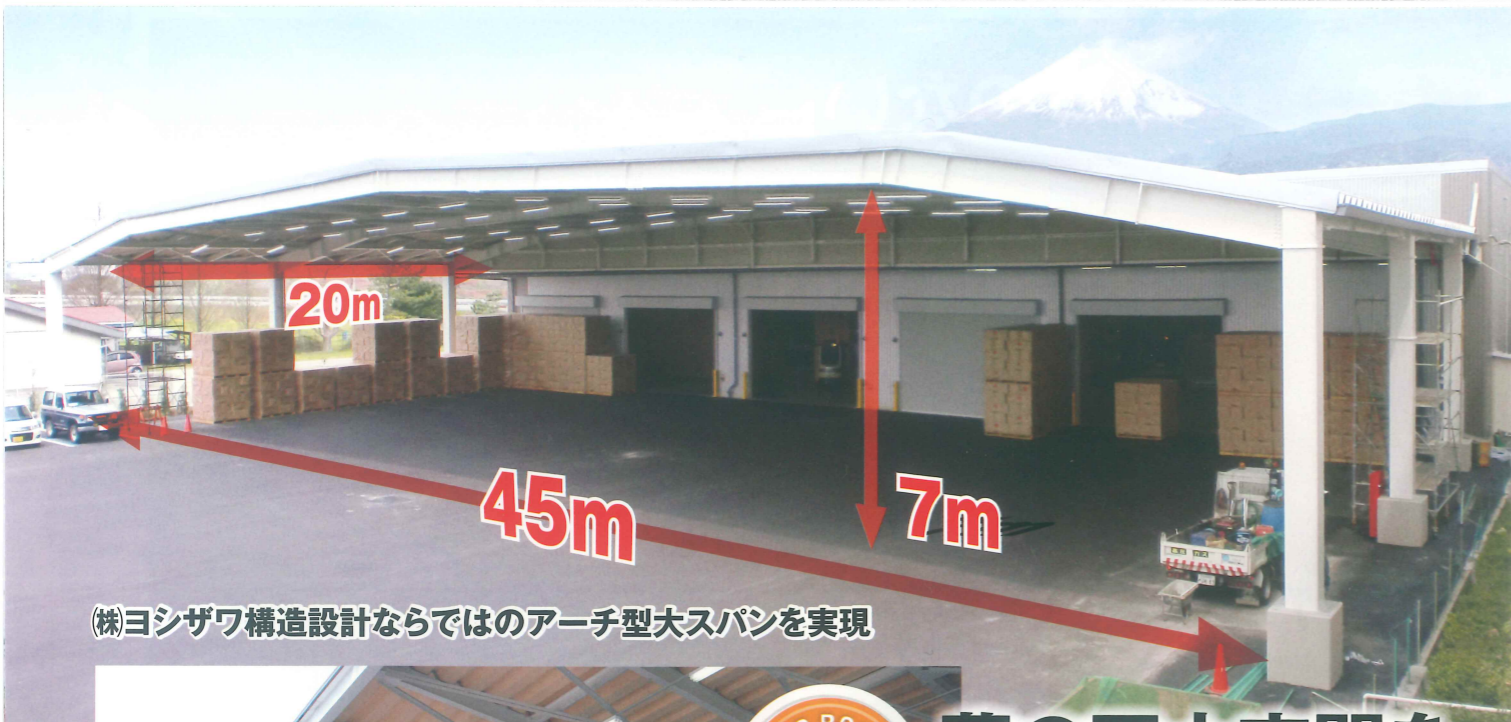
(株)ヨシザワ構造設計ならではのアーチ型大スパンを実現