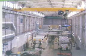
鶴見製紙(株)様 耐震補強