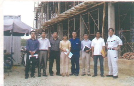
いちばん右が弊社社長