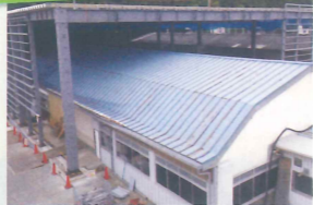
金属加工業様 カバービルド(かぶせ工法)