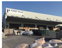
十分な作業スペースがとれない