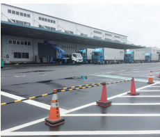
既存の荷捌き場は庇があるものの、資材が風雨にさらされることもあった