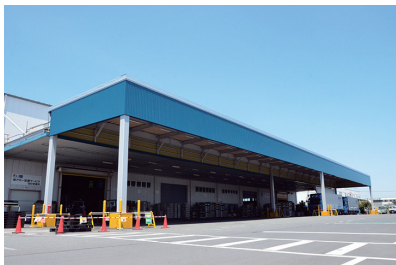
2. 強度に優れた6本の柱を設置し、トラックが出入りしやすい荷捌きスペースに