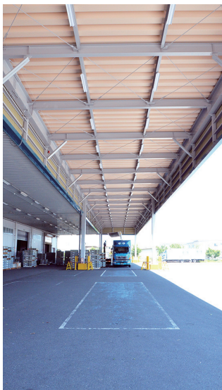
3. ウイングタイプのトラックでも荷捌きが可能な大空間