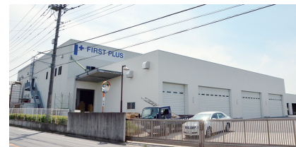
3. 以前よりも広い屋内、荷捌きスペースとして変身