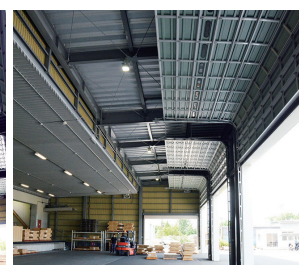
2. 大開口に適したアルミのオーバーライダーを使用