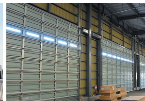
4. 開口扉はシャッター式に