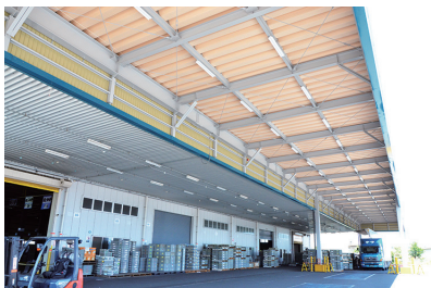
1. 荷捌きスペースの庇部分を約2倍に拡張