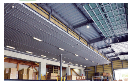
1. 既存の庇を新設した屋根の一部に取り組むことで強度を確保

外見も既存建屋と完全に一体化した 悪天候にも左右されない屋内荷捌き スペースに!